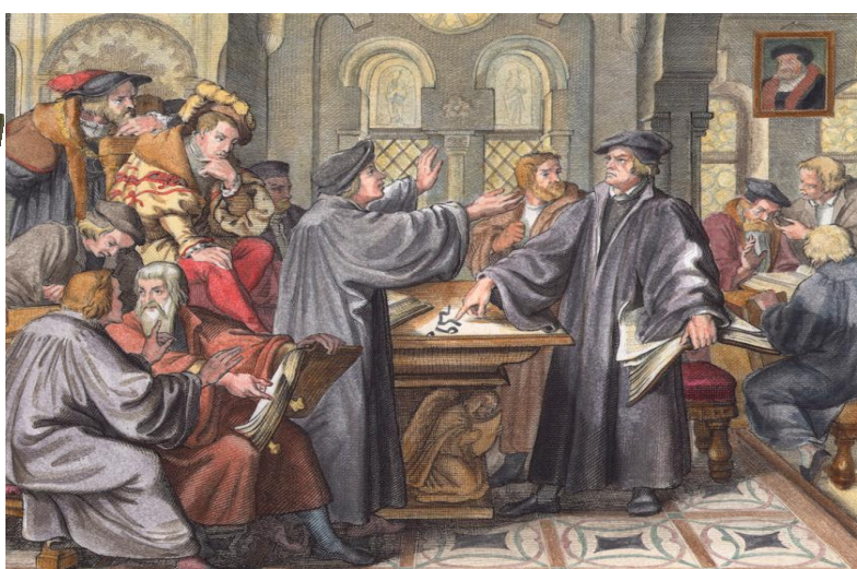
Disputa tra Lutero e Zwingli (Gustav König, 1847)