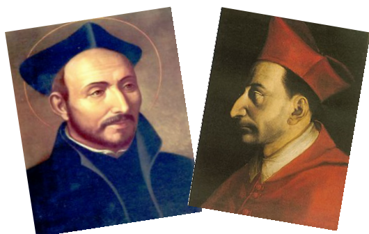
Due giganti della Controriforma I. di Loyola e C. Borromeo

Venerdì 23 febbraio 2018 - dalle 19.00 alle 20.30